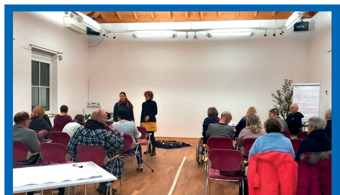
Selbsthilfe AG-Sitzung in der VHS in Bergisch Gladbach.