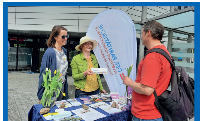
Infostand auf dem Markt in Wermelskirchen.