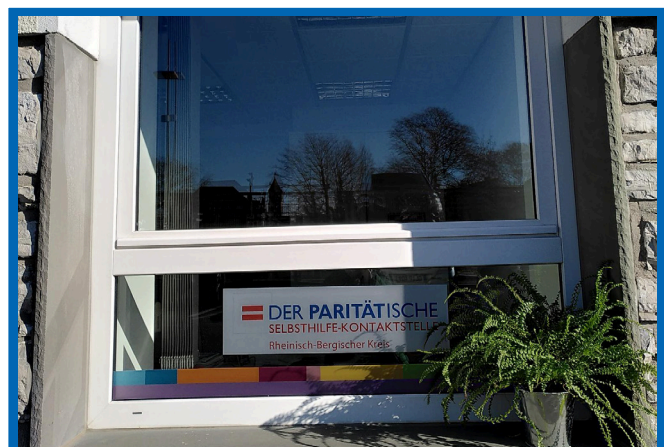
Die Selbsthilfe-Kontaktstelle Rheinisch-Bergischer Kreis