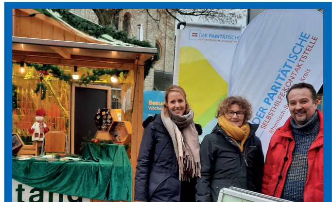
Sozialstand auf dem Bergisch Gladbacher Weihnachtsmarkt.