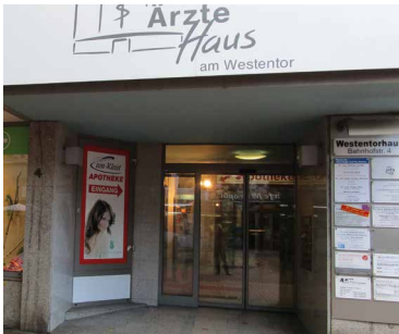
Sitz der Selbsthilfe-Kontaktstelle Hamm.

Die Selbsthilfe-Kontaktstelle Hamm ist die zentrale Informations- und Beratungsstelle für alle Fragen zur Selbsthilfe. Sie bietet professionelle Unterstützung für Menschen, die Selbsthilfegruppen suchen oder gründen möchten. Auch bestehende Gruppen werden beraten und vernetzt.