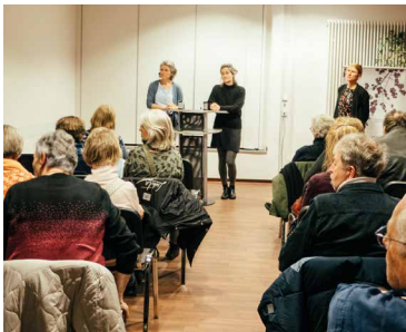
Foto-Vortrag im FeidikForum