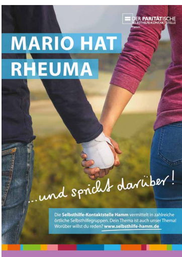
Motiv aus der Serie „Pack dein Problem beim Schopf“.

In 2023 verzeichnete die Selbsthilfe-Kontaktstelle 2.057 Kontakte. Davon erreichten uns 1.492 Kontakte über Email bzw. den Postweg, 464 telefonisch und 101 persönlich. Die Anfragen zum Thema psychische Erkrankungen sind insbesondere in 2022, aber auch in 2023 deutlich im Vergleich zu den Vorjahren gestiegen (siehe Grafik).