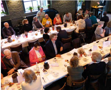
Gäste beim 25-jährigen Jubiläum